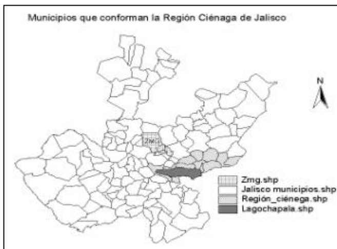
Mapa 1. Municipios que conforman la Región Ciénega de Jalisco.

En este texto nos interesa abordar el aspecto social del desarrollo que están produciendo las remesas colectivas a través del Programa 3x1 para Migrantes. Nos centraremos en la Región de la Ciénega de Jalisco que está conformada por 13 municipios (Mapa 1) y que representa una de las regiones (junto con Los Altos de Jalisco) más dinámicas en cuanto a inversión en este tipo de remesas y en dicho programa.