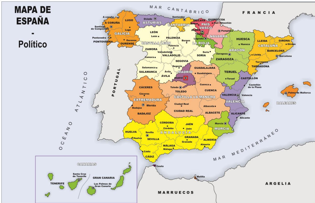
Figura 2. Situación geográfica