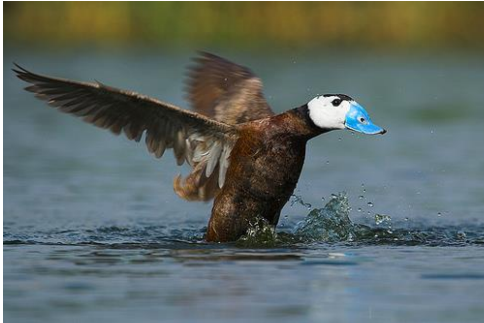
Figura 1. Avistamiento de Malvasía cabeciblanca