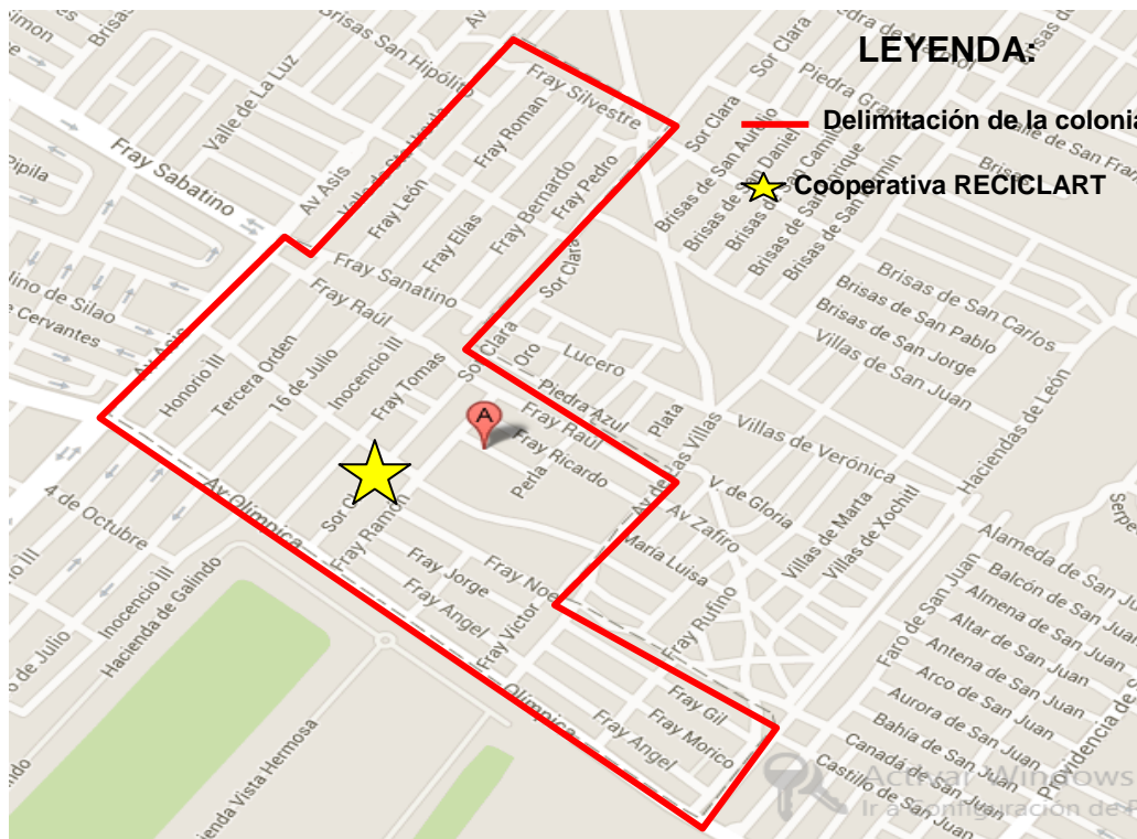
Ubicación geográfica de la colonia Ampliación San Francisco