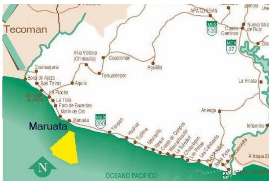
Mapa de Maruata, Michoacán.

Estas regiones naturales, regiones de refugio, como las llama Gonzalo Aguirre Beltrán, han sido codiciadas por la estructura dominante debido a su carácter de “fundamento” 11 , lo que implica abundancia de recursos naturales, es esta característica la que vuelve a estos sitios deseables por la inversión privada, en el caso de Maruata, por el sector turismo, debido a la belleza de sus playas. “La sociedad industrial las tiene como regiones de reserva destinadas al uso futuro de recursos que, por ser más abundantes o asequibles en otras regiones, no exigen en la actualidad denuevos mayores de los habituales” 12 .