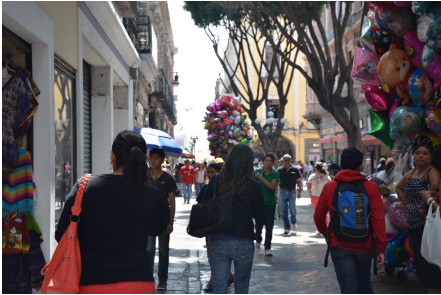
Imagen 3 Principales calles Centro Histórico Puebla