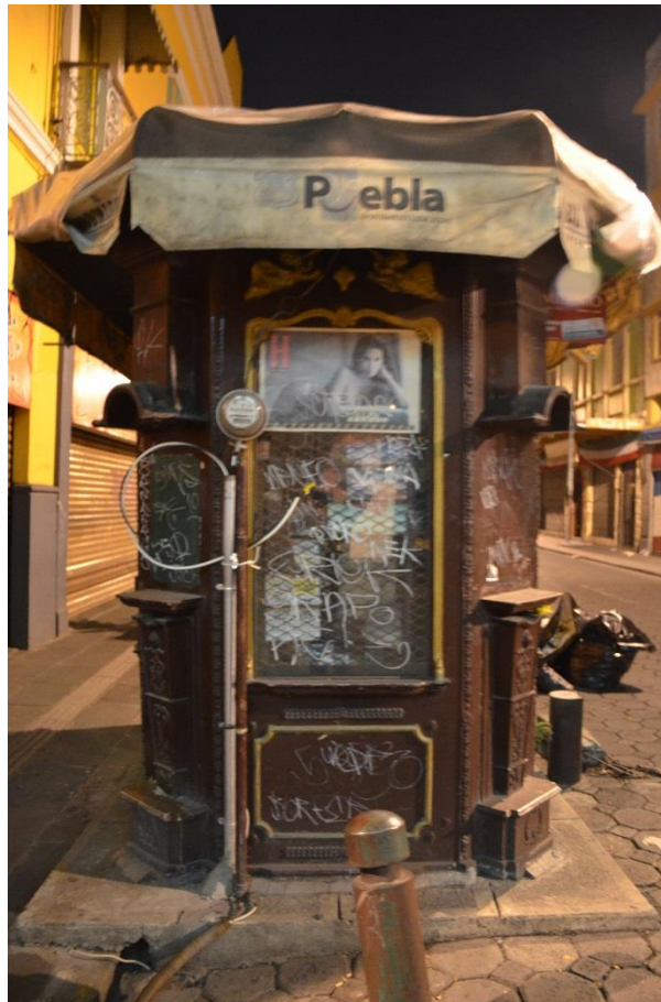
Imagen 1 proceso de degradación Cento Historico Puebla

En proceso de degradación: Situado en la parte oriental de la zona de monumentos y cubre el 15% de la superficie, hay barrios con déficit en los servicios; espacios públicos no tienen vida social y los edificios comienzan deterioro por falta de mantenimiento.